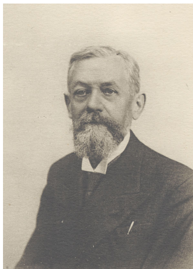
Fig. 1 – Emmanuel de Martonne (sans date).

«Les progrès de la Géographie des êtres vivants n'ont rien à voir avec les circonstances politiques. Ils sont le résultat d'efforts persévérants et continus et apparaissent plutôt comme un fruit qui mûrit lentement» 1 .